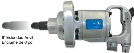
6" Extended Anvil Enclume de 6 po