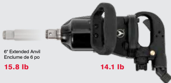
6" Extended Anvil Enclume de 6 po