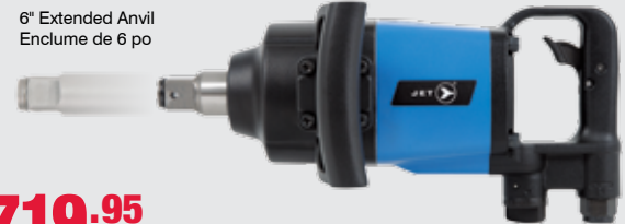
6" Extended Anvil Enclume de 6 po