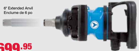
6" Extended Anvil Enclume de 6 po