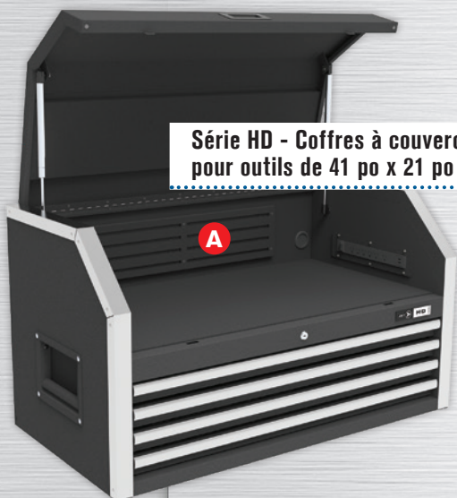
Série HD - Coffres à couvercle à 4 tiroirs et avec parois magnétiques pour outils de 41 po x 21 po