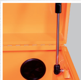
Amortisseurs à gaz à usage intensif pour garder le couvercle ouvert