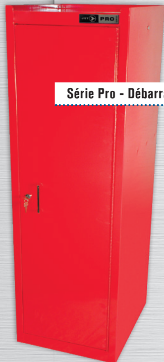
Série Pro - Débarras pour 56 po Série Pro