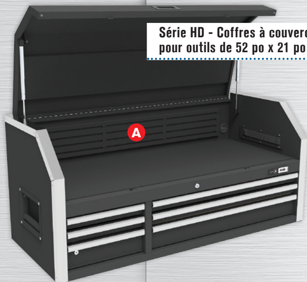
Série HD - Coffres à couvercle à 6 tiroirs et avec parois magnétiques pour outils de 52 po x 21 po

Profondeur des tiroirs : 18,7 po Profondeur totale : 21,5 po