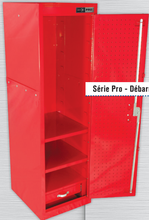
Série Pro - Débarras pour 42 po Série Pro