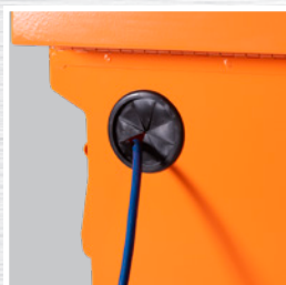
Passe-fils en caoutchouc pour faciliter le passage de cordons électriques

Deux boîtes dissimulées qui préviennent l'utilisation de coupe-boulons ou de scies pour couper les verrous