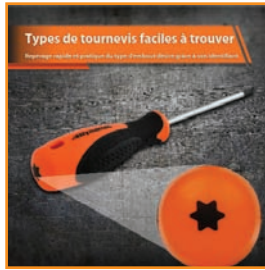
Types de tournevis faciles à trouver