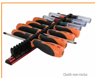
Outils non inclus