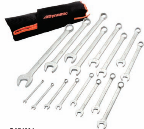
D074221 Jeu de 16 clés mixtes SAE Série Entrepreneur

• 1/4 à 1 1/4 po Prix courant : 221,52 $