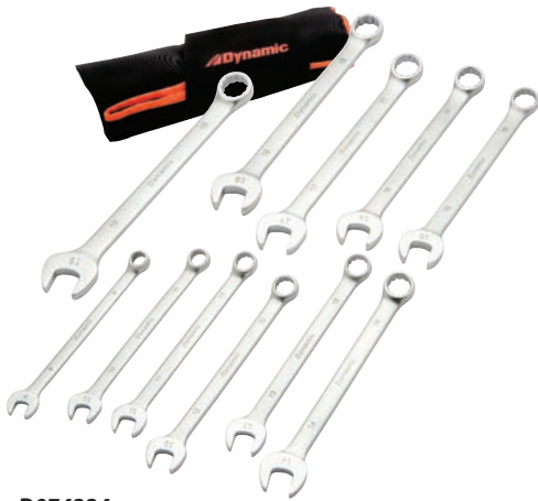
D074224 Jeu de 11 clés mixtes métriques Série Entrepreneur