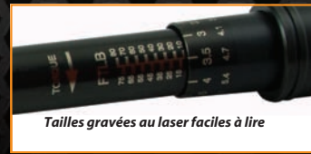
Tailles gravées au laser faciles à lire