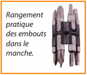
Rangement pratique des embouts dans le manche.