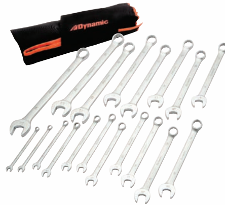
D074223 Jeu de 19 clés mixtes métriques Série Entrepreneur