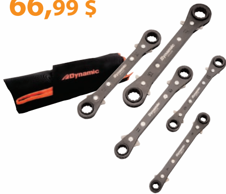
Jeu de 5 clés polygonales doubles à cliquet, réversibles, coudées à 25°

Modèle SAE Gamme de taille Prix courant D081201 SAE 1/4 x 5/16 po à 3/4 x 7/8 po 94,23 $ 63,99 $