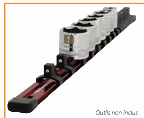
Outils non inclus